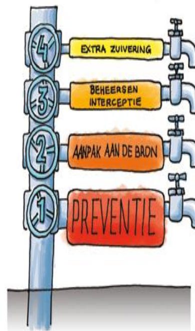
Figuur 1.1 Preventieladder

Daarna dienen gebiedspartners zich hieraan te committeren.